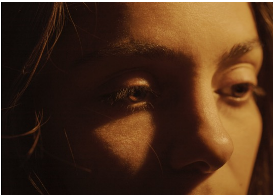
LAURA STEVENS Surface (2023) Tirage pigmentaire d'archive 50x65 cm