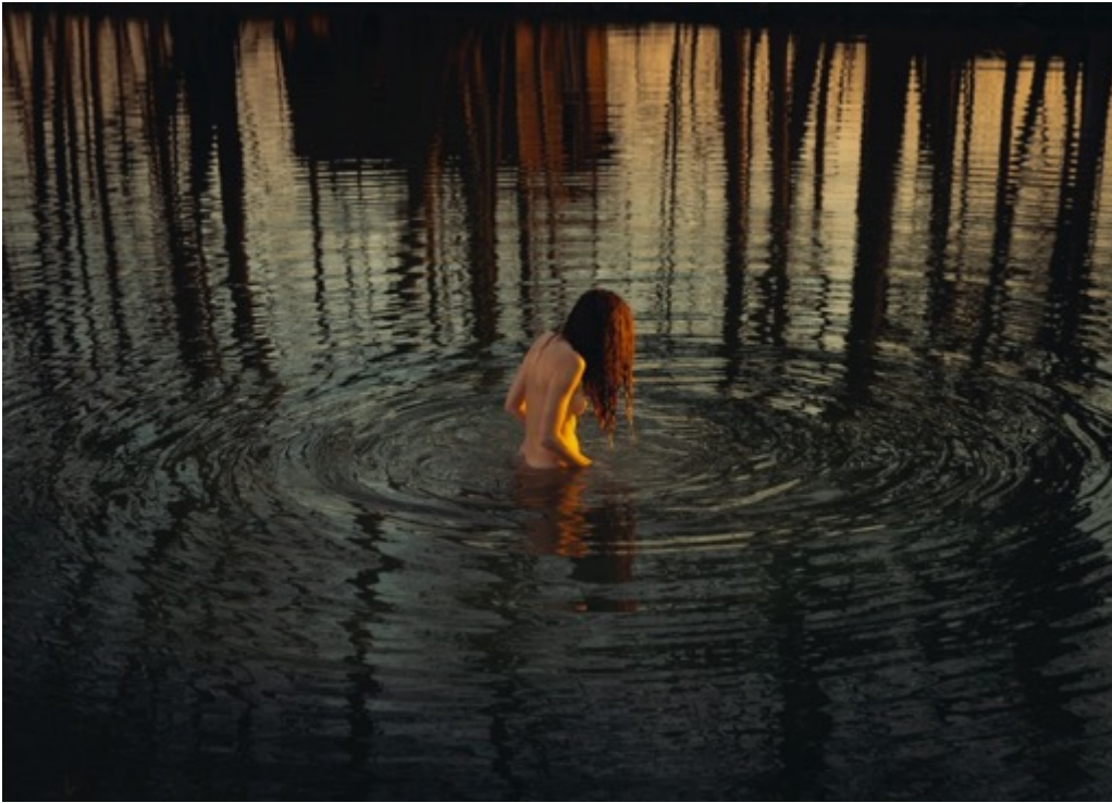
LAURA STEVENS Threshold (2023) Tirage pigmentaire d'archive 70x100cm