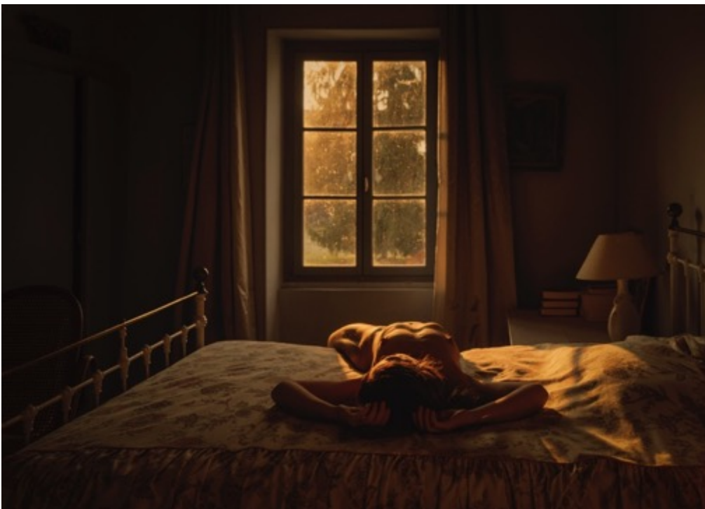
LAURA STEVENS Altar (2023) Tirage pigmentaire d'archive 70x100cm