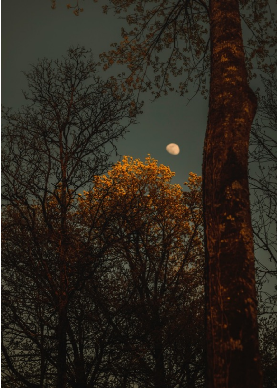
LAURA STEVENS Yellow leaves, waxing moon (2023) Tirage pigmentaire d'archive 100x70cm