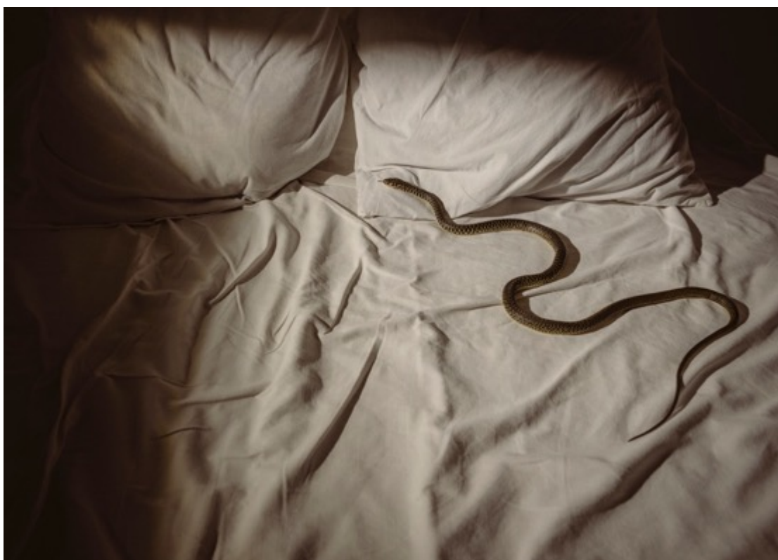
LAURA STEVENS Snake (2023) Tirage pigmentaire d'archive 70x100cm