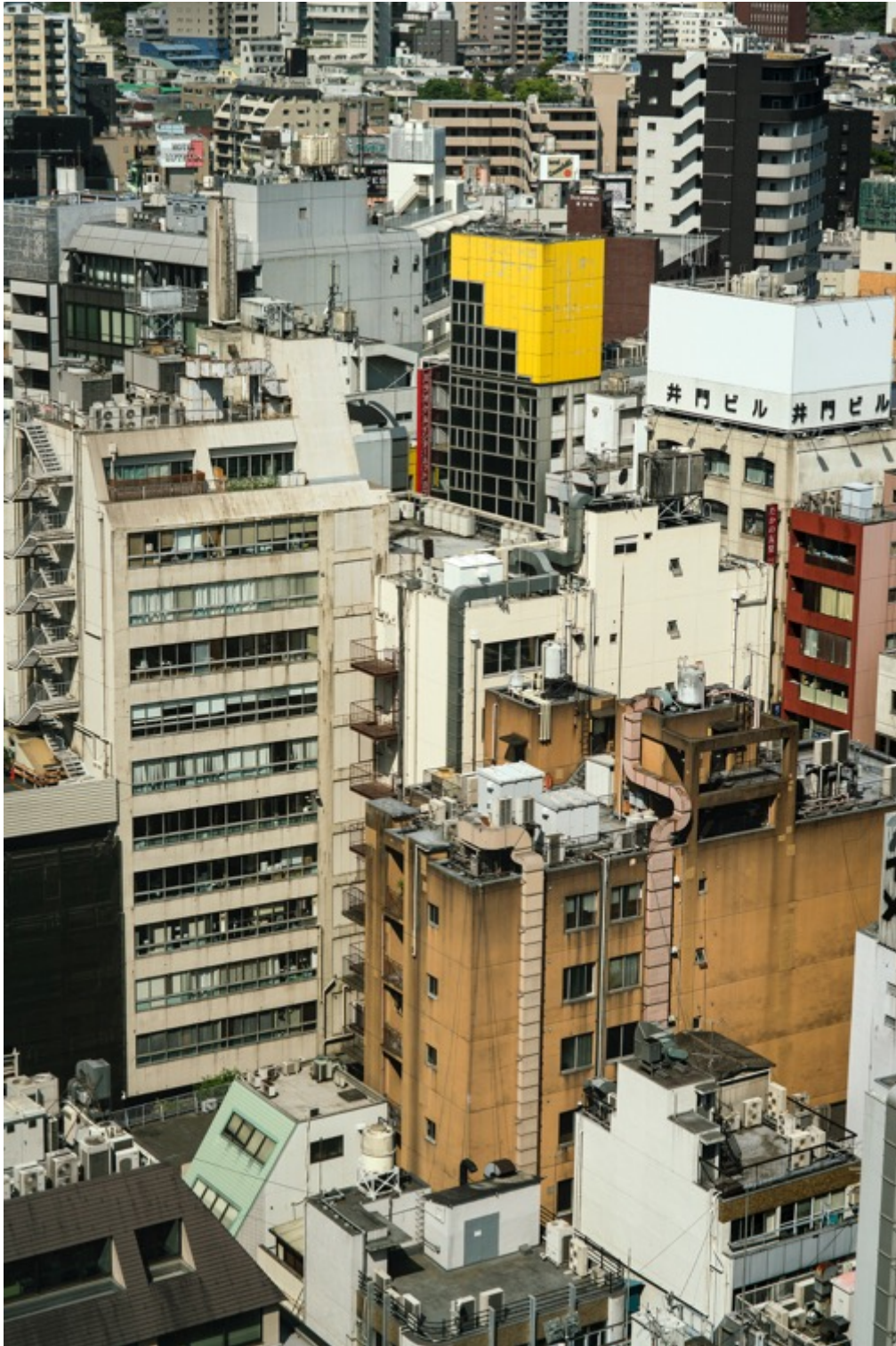
TERRI WEIFENBACH Air and Dreams #173 Tirage pigmentaire d'archive 127 x 91.4 cm Edition de 10 + 2 EA

Différents formats sont possibles dans l'édition de 10