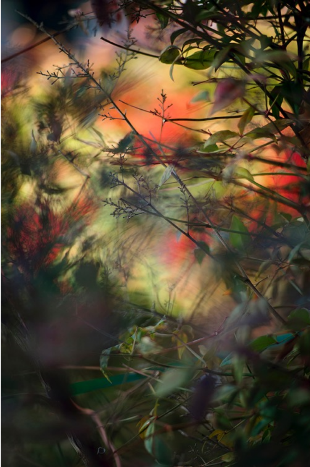
TERRI WEIFENBACH Air and Dreams #00450 Tirage pigmentaire d'archive 76 x 50.8 cm Edition de 10 + 2 EA

Différents formats sont possibles dans l'édition de 10