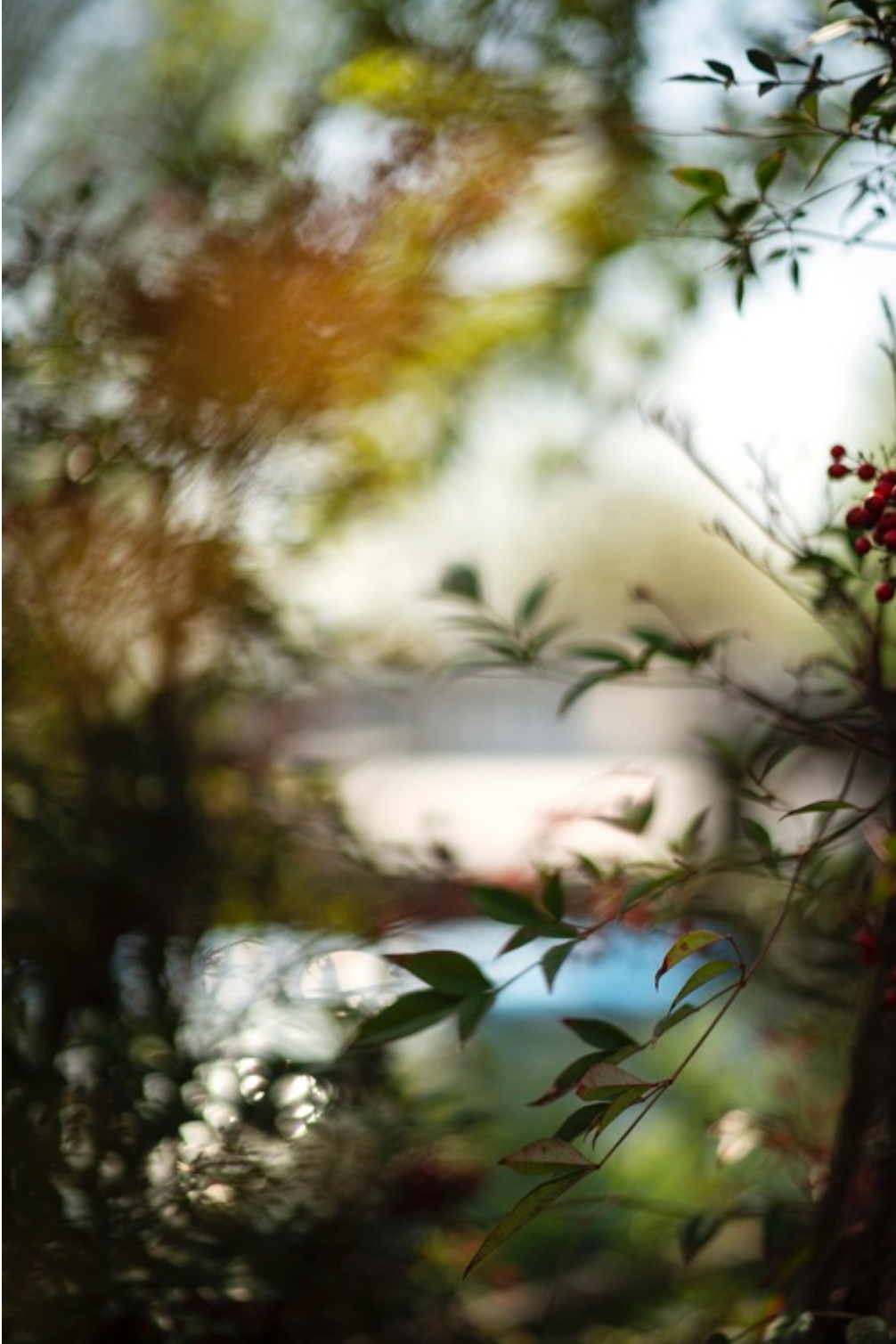
TERRI WEIFENBACH Air and Dreams #5467 Tirage pigmentaire d'archive 127 x 91.4 cm Edition de 10 + 2 EA

Différents formats sont possibles dans l'édition de 10