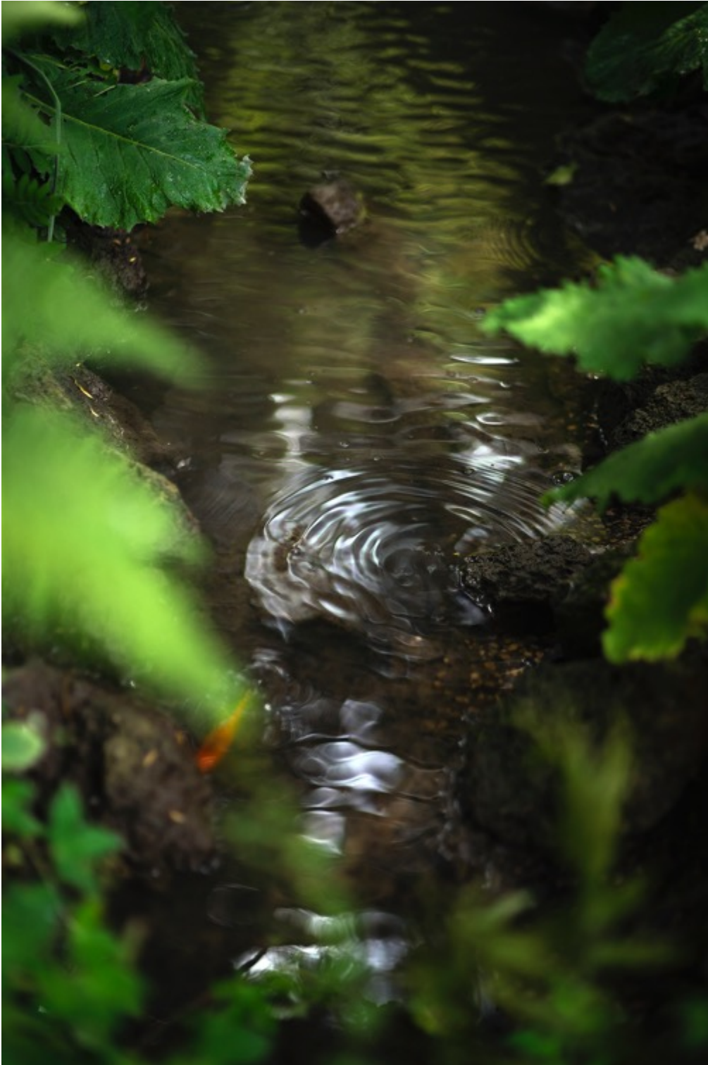
TERRI WEIFENBACH Air and Dreams #104 Tirage pigmentaire d'archive 76 x 50.8 cm Edition de 10 + 2 EA

Différents formats sont possibles dans l'édition de 10