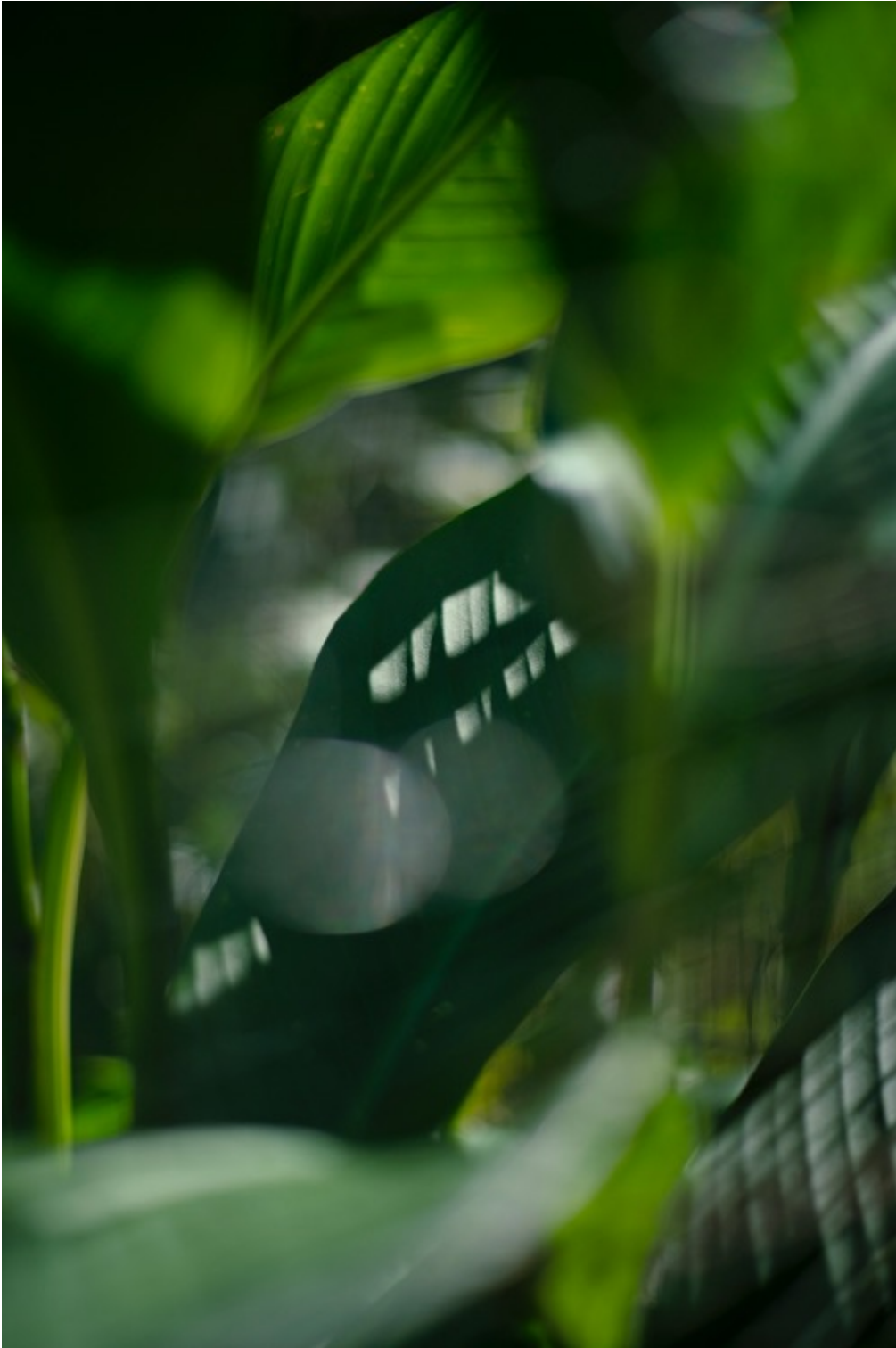
TERRI WEIFENBACH Air and Dreams #129 Tirage pigmentaire d'archive 76 x 50.8 cm Edition de 10 + 2 EA

Différents formats sont possibles dans l'édition de 10