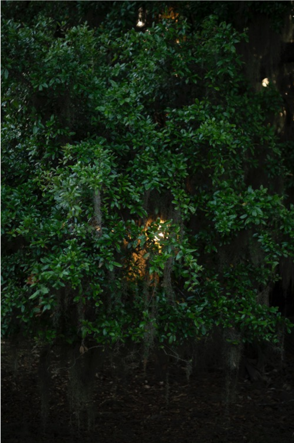
TERRI WEIFENBACH Air and Dreams #15 Tirage pigmentaire d'archive 127 x 91.4 cm Edition de 10 + 2 EA

Différents formats sont possibles dans l'édition de 10