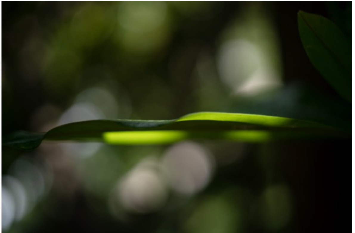
TERRI WEIFENBACH Air and Dreams #110 & #9579 Tirage pigmentaire d'archive 76 x 50.8 cm Edition de 10 + 2 EA

Différents formats sont possibles dans l'édition de 10