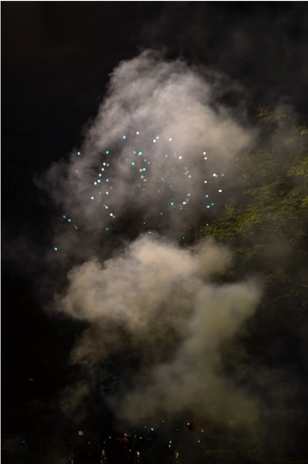
TERRI WEIFENBACH Air and Dreams #197 Tirage pigmentaire d'archive 76 x 50.8 cm Edition de 10 + 2 EA

Différents formats sont possibles dans l'édition de 10