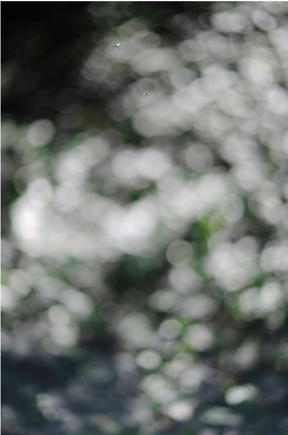
TERRI WEIFENBACH Air and Dreams #118 Tirage pigmentaire d'archive 76 x 50.8 cm Edition de 10 + 2 EA

Différents formats sont possibles dans l'édition de 10