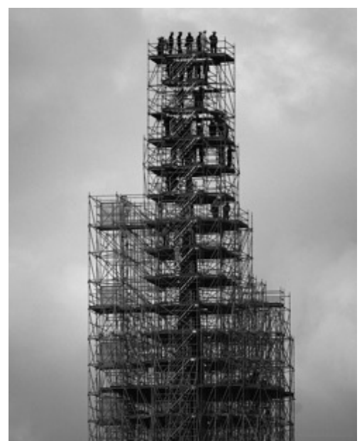
L'achèvement de la nouvelle flèche de la cathédrale Notre-Dame , 2023