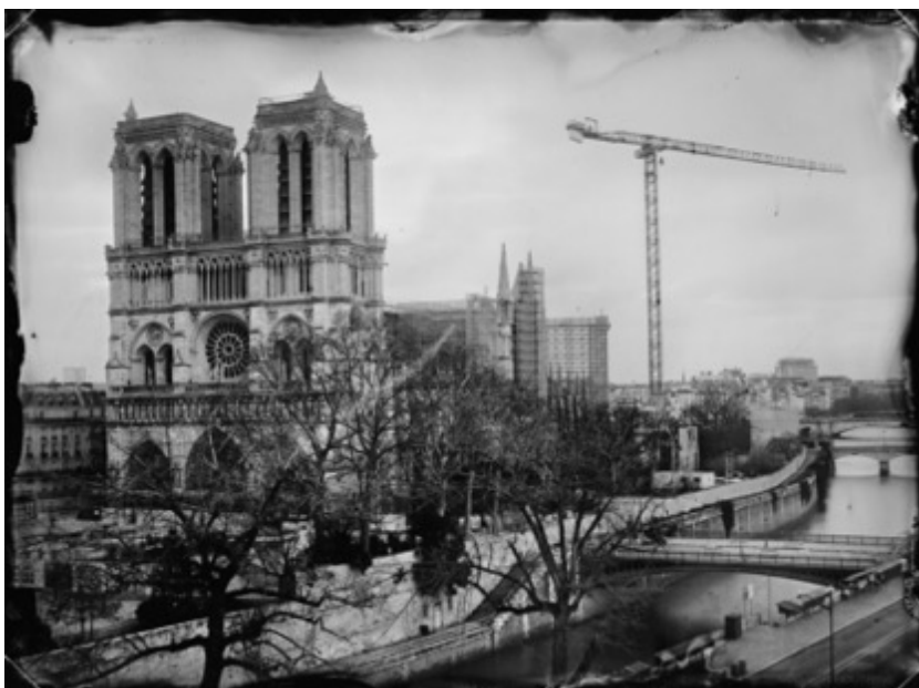
TOMAS VAN HOUTRYVE La cathédrale Notre-Dame sans flèche , 2022 Collodion humide