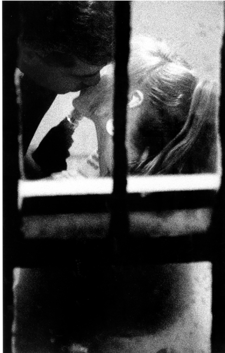
Merry Alpern, Dirty Windows #2 , 1994

Tirage argentique de l'époque / vintage silver gelatin print 50 x 40 cm / 20 x 16 in.