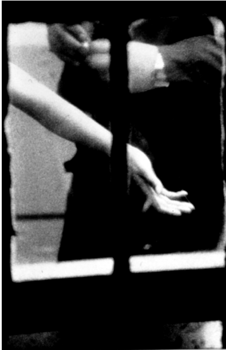
Merry Alpern, Dirty Windows #6 , 1994

Tirage argentique de l'époque / vintage silver gelatin print 50 x 40 cm / 20 x 16 in.