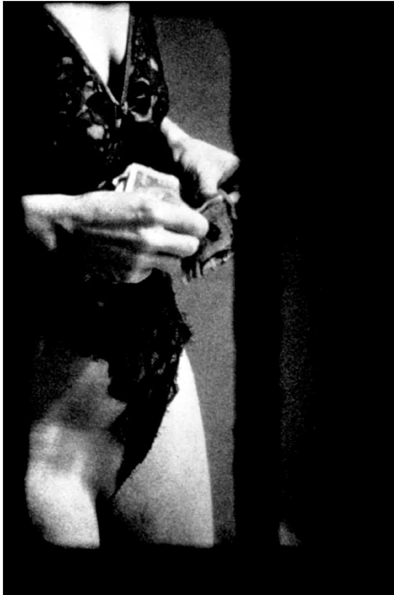
Merry Alpern, Dirty Windows #5 , 1994

Tirage argentique de l'époque / vintage silver gelatin print 50 x 40 cm / 20 x 16 in.