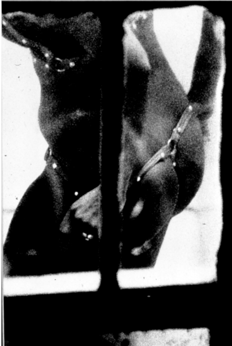
Merry Alpern, Dirty Windows #12 , 1994

Tirage argentique de l'époque / vintage silver gelatin print 50 x 40 cm / 20 x 16 in.