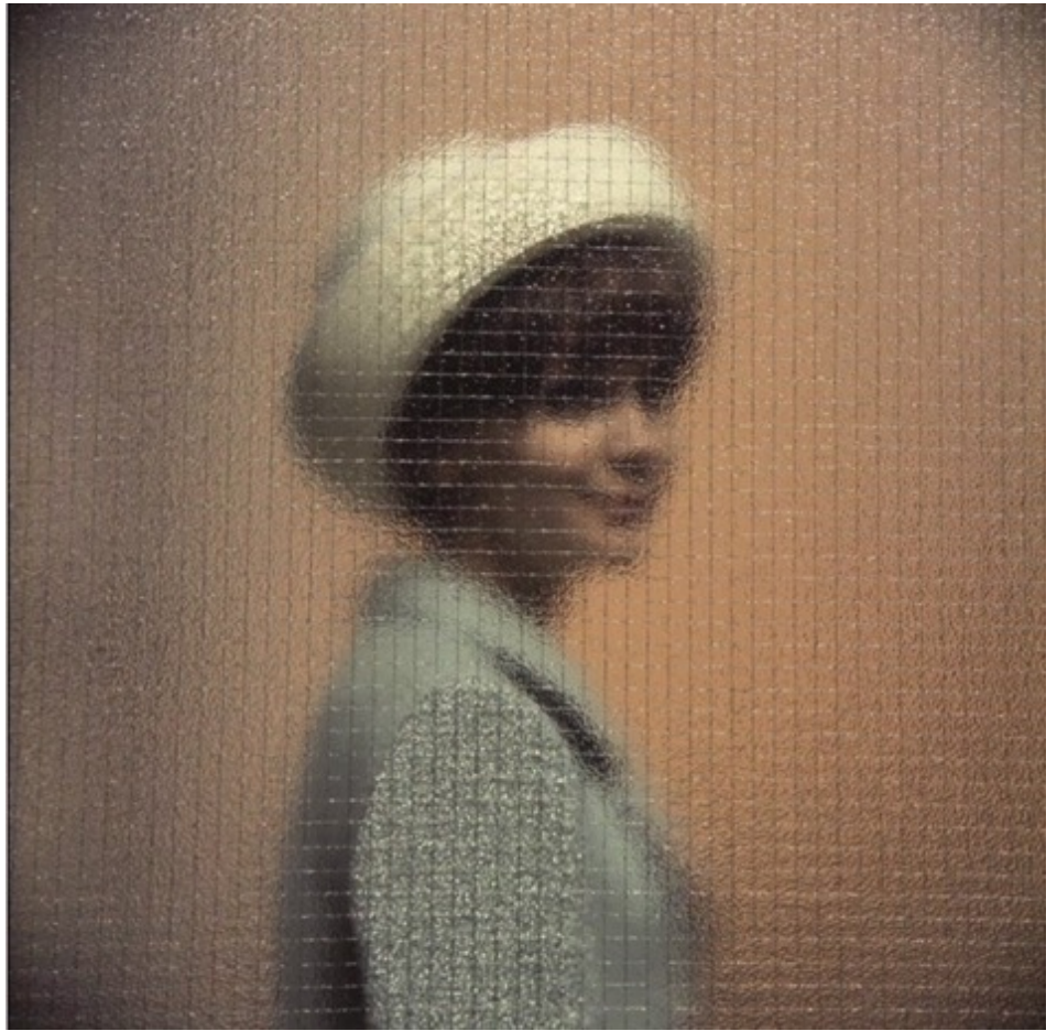
Woman behind glass , c. 1958 Tirage chromogénique 60 cm x 60 cm