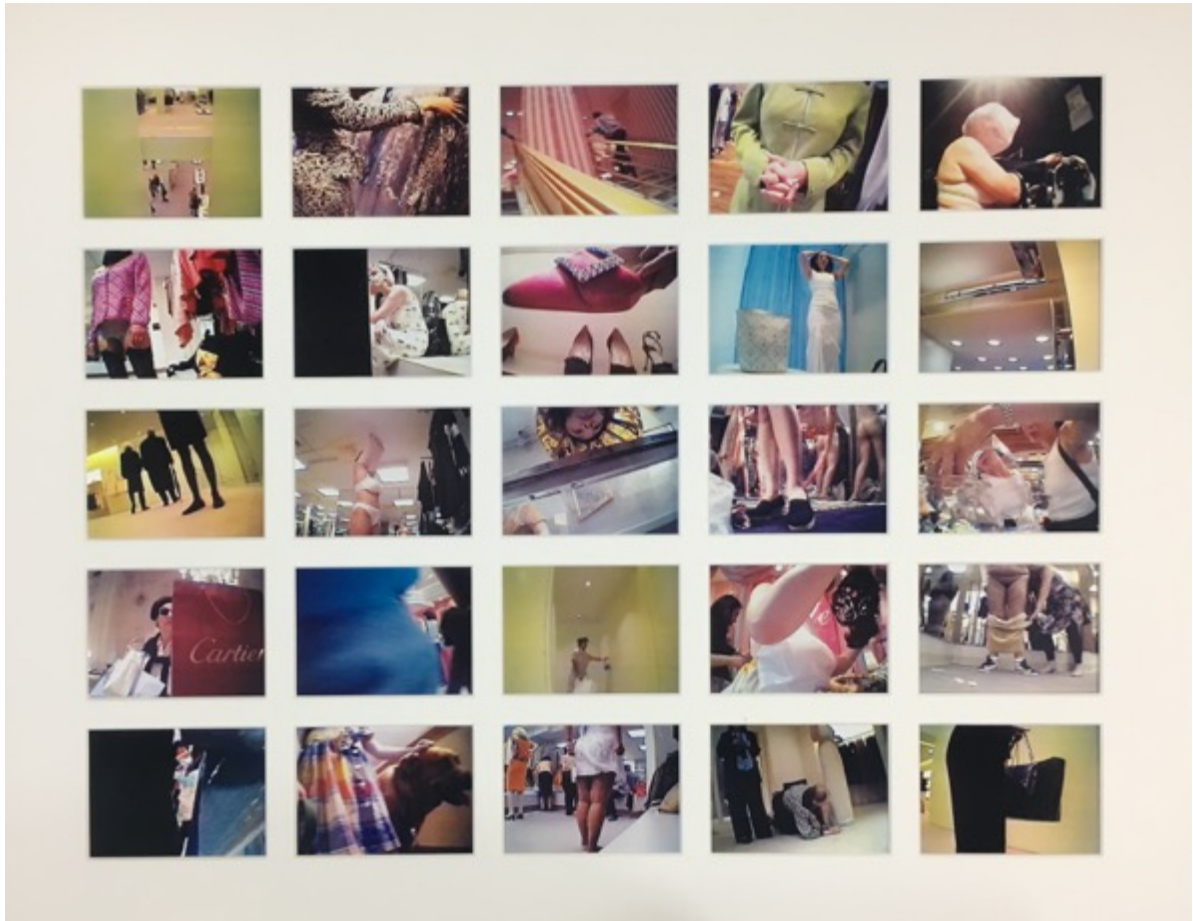
Shopping (1999) Grille de 25 photographies tirées de la vidéo 'Shopping' 75 x 62 cm Unique