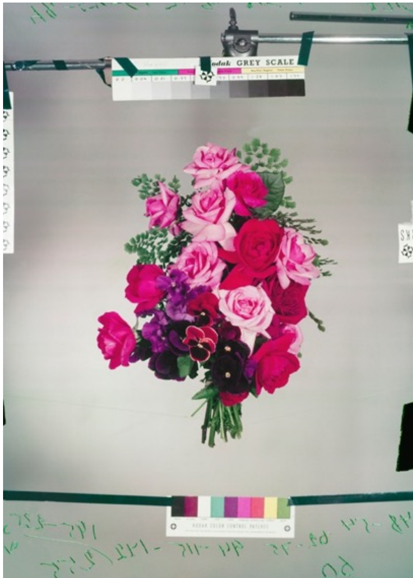
Flowers 1, 1950s Tirage chromogénique 43 cm x 60 cm