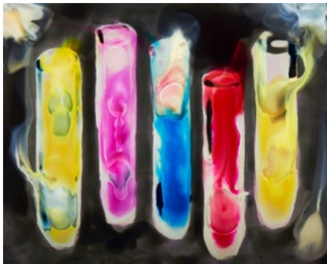
Test Tubes 2, 2015 40 x 50 cm Tirage pigment d'archive