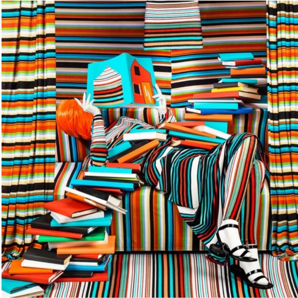
Striped Books: engrossed in her reading, the books coloured her life, 2018 De la série Anonymous Women: Demise Tirage chromogénique numérique 55 x 55 cm