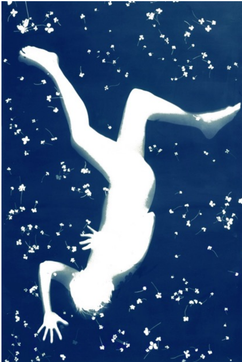
Falling Angel #11 Photogramme en cyanotype 220 x 140 cm Unique