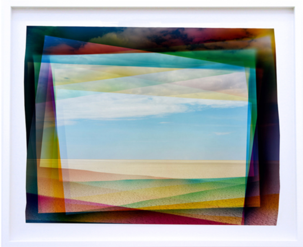
Parallax, 2017 Tirage chromogénique 93,5 x 114,5 cm (encadré) Unique