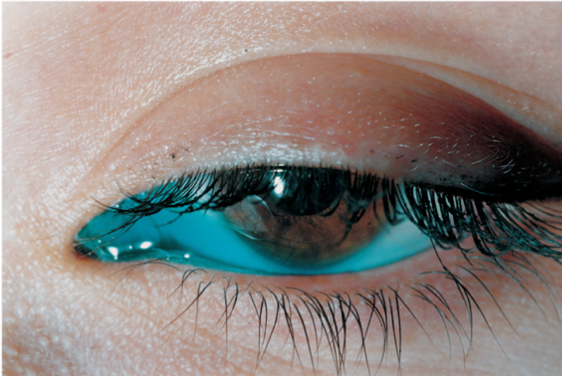
Eye, 1996 De la série Closer Tirage chromogénique 50 x 60 cm