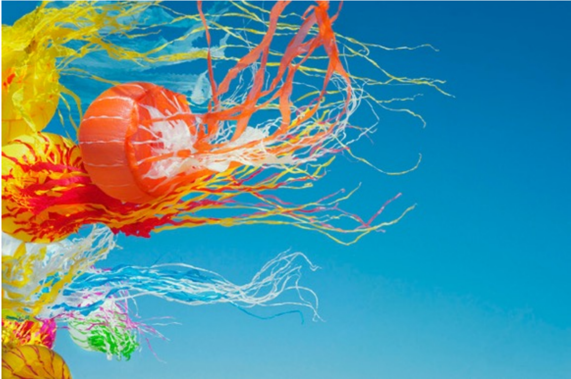
Medusae, 2018 From Heavenly Creatures series Tirage chromogénique 85 x 55 cm / 34" x 22"