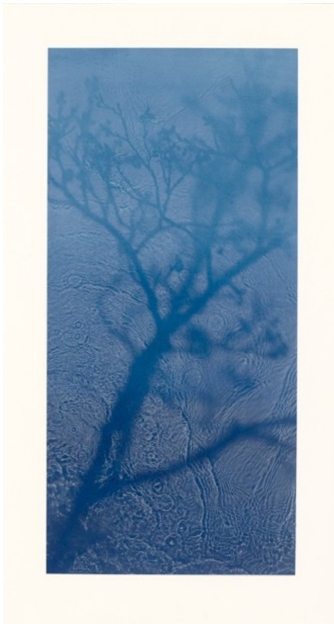
Willow, 2018 Photogravure polymer 61 X 29 cm