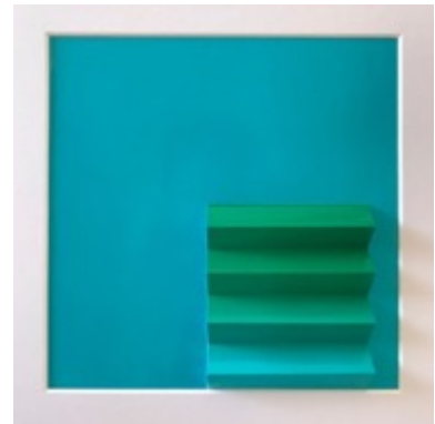
Altered Plane #3, Altered Plane #5, Altered Plane #1, 2018 De la série Lightfalls C-Type Luminograms Signé et daté au verso par l'artiste Trois photographies uniques, coupées et pliées 20 x 22 cm / 36 x 36 cm encadrées