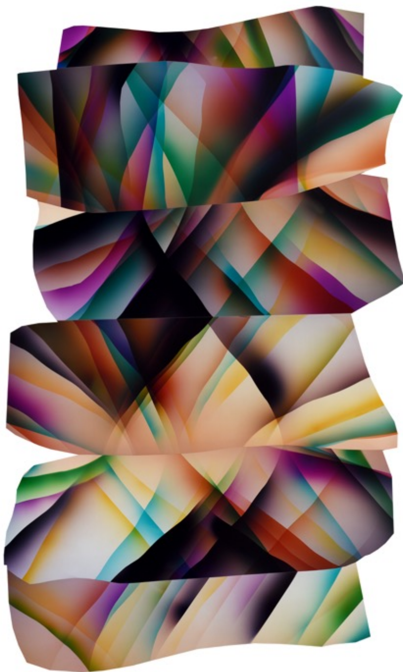
Chloe SELLS The Form, 2017 Tirage chromogénique 168 x 106 cm