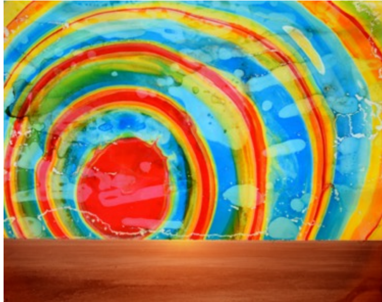
Chloe SELLS Feel the sun, 2019 Tirage chromogénique avec de l'encre 10 x 12 cm Unique

CHLOE SELLS PETITS FORMATS: TIRAGES CHROMOGÉNIQUES PEINTS À LA MAIN, UNIQUES 4x5 in / 10x12 cm