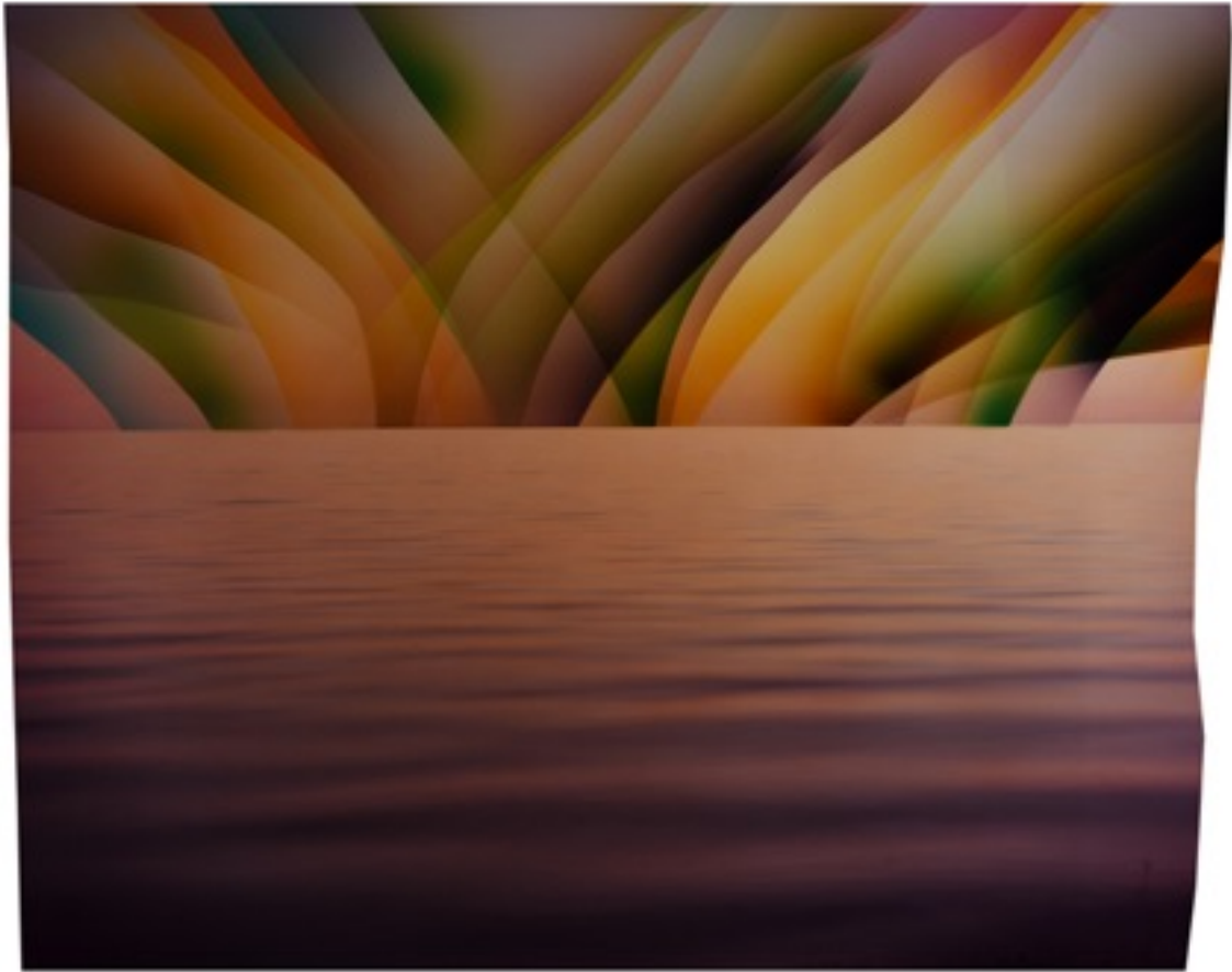
Chloe SELLS The Whisperers, 2016 Tirage chromogénique 93,5 x 113 cm