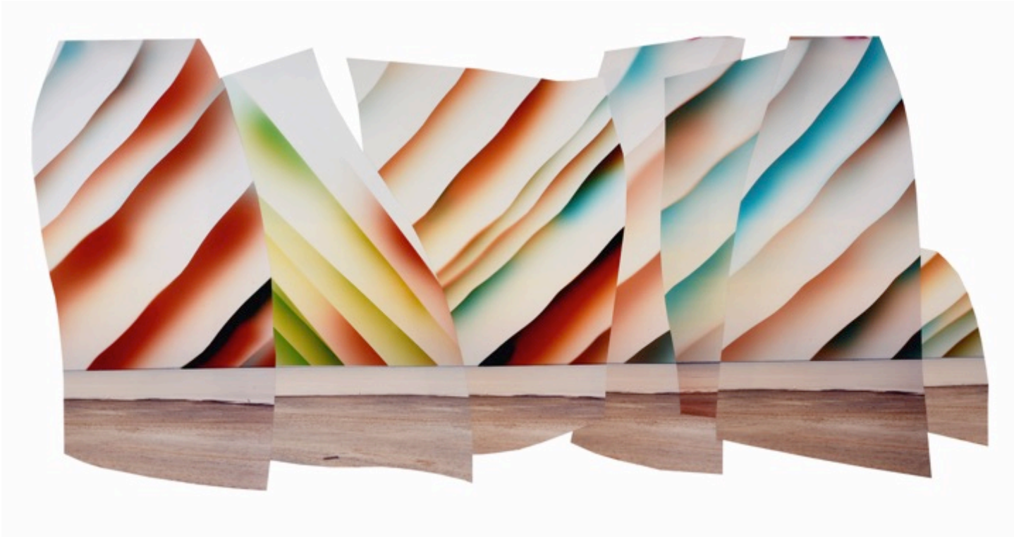
Chloe SELLS The Nare, 2017 Tirage chromogénique 90 x 176 cm