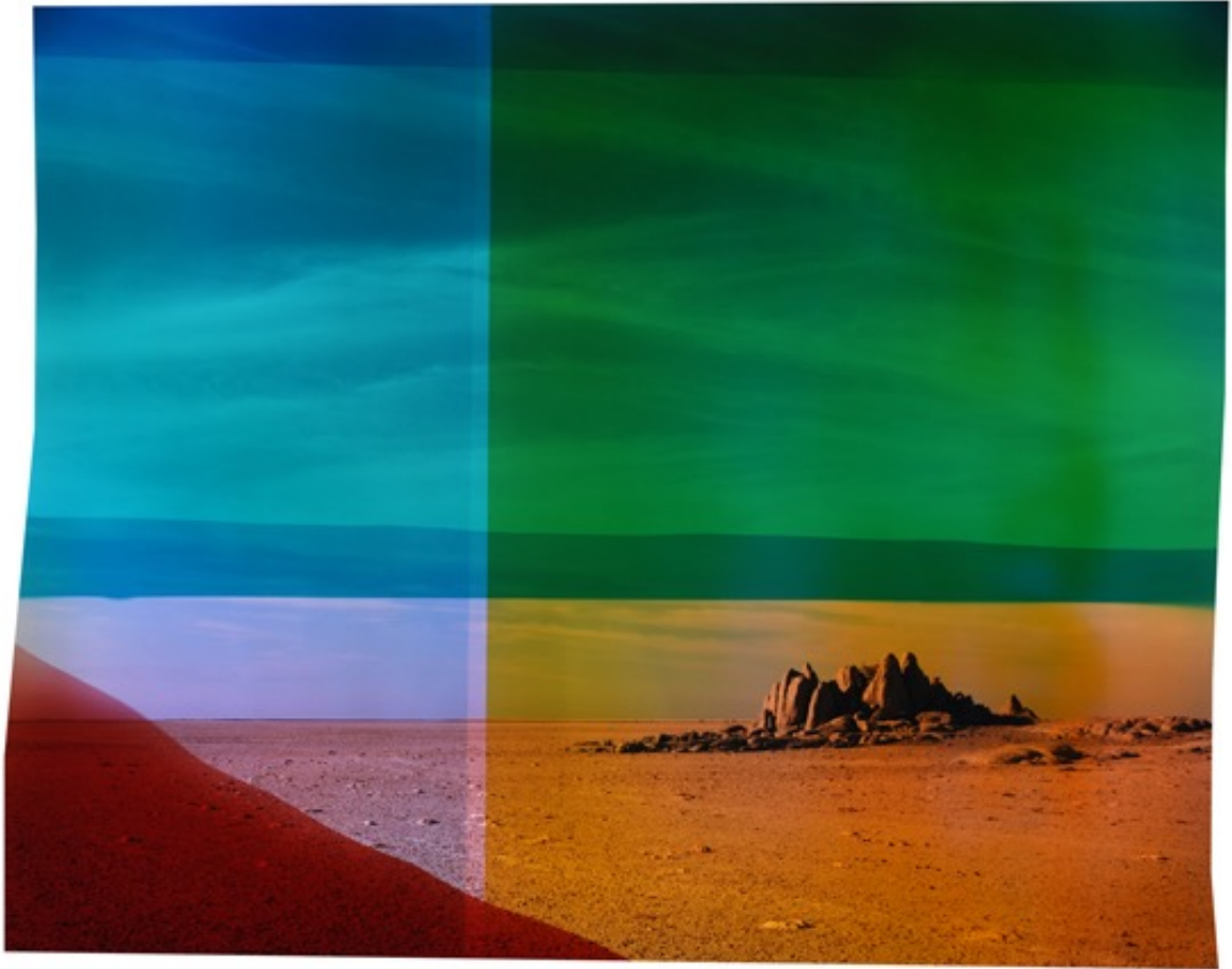
Chloe SELLS The Turning away, 2017 Tirage chromogénique 93,5 x 113 cm