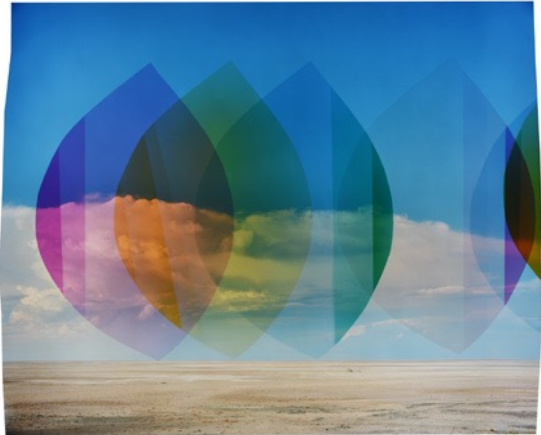
Chloe SELLS Shadow At Morning, 2017 Tirage chromogénique 93,5 x 113 cm