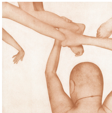
Family matter 6, 2008/2013 Tirage gomme bichromatée avec du sang 25.5 x 25.5 cm