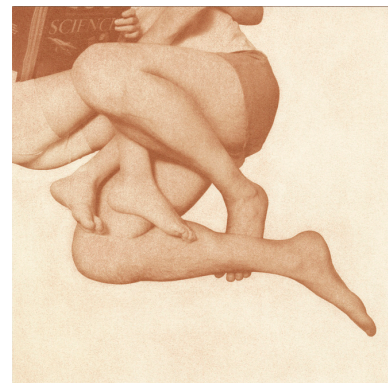
Family matter 7, 2008/2013 Tirage gomme bichromatée avec du sang 25.5 x 25.5 cm