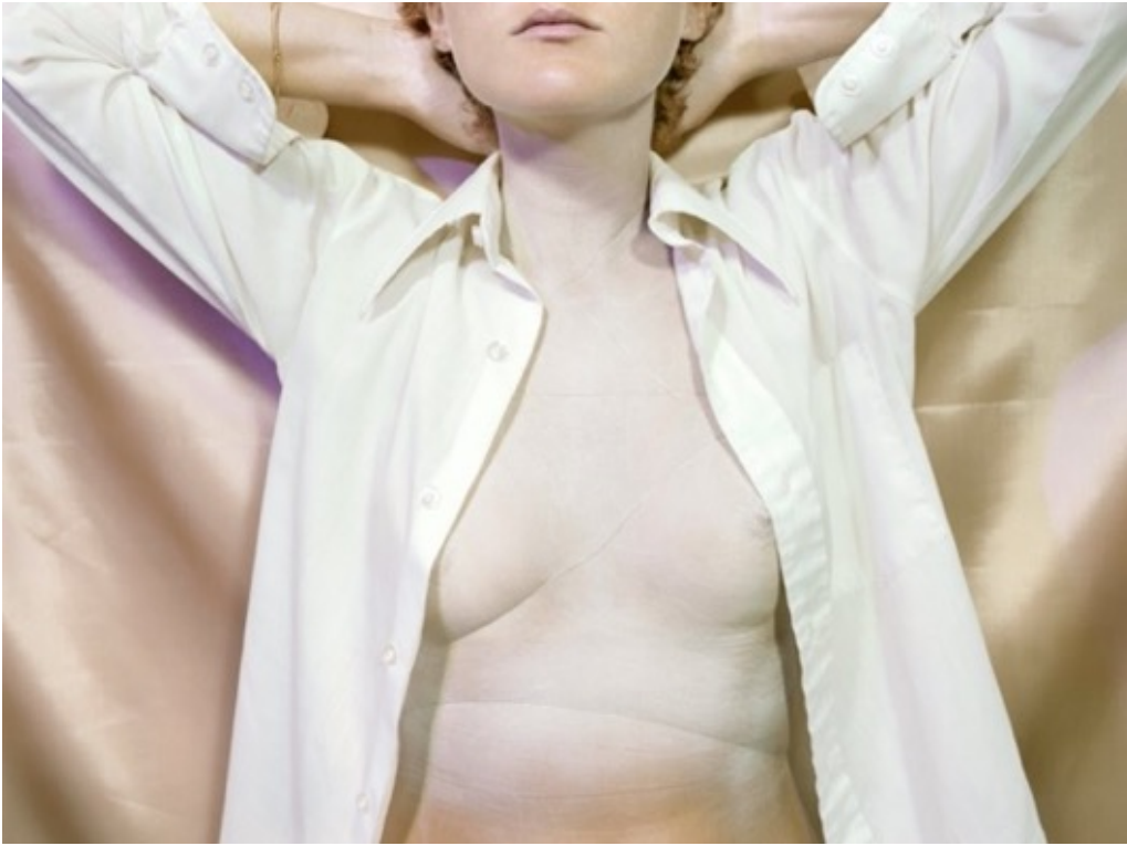
JO ANN CALLIS Untitled , from Early Color portfolio , c. 1976 Tirage pigmentaire d'archive 16x20 inch / 40,6x50,8 cm