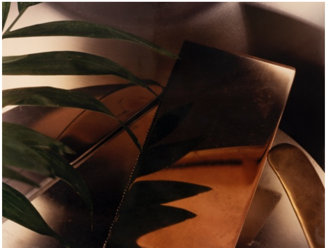
JAN GROOVER Untitled , 1979 KSL 073.3 Tirage chromogénique d'époque 16x20 inch / 40,6x50,8 cm (c) Jan Groover / Galerie Miranda