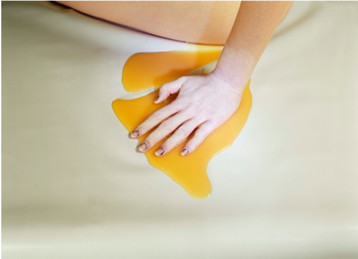
JO ANN CALLIS Untitled, from Early Color portfolio, c. 1976 Tirages pigmentaire d'archive 16x20 inch / 40,6x50,8 cm