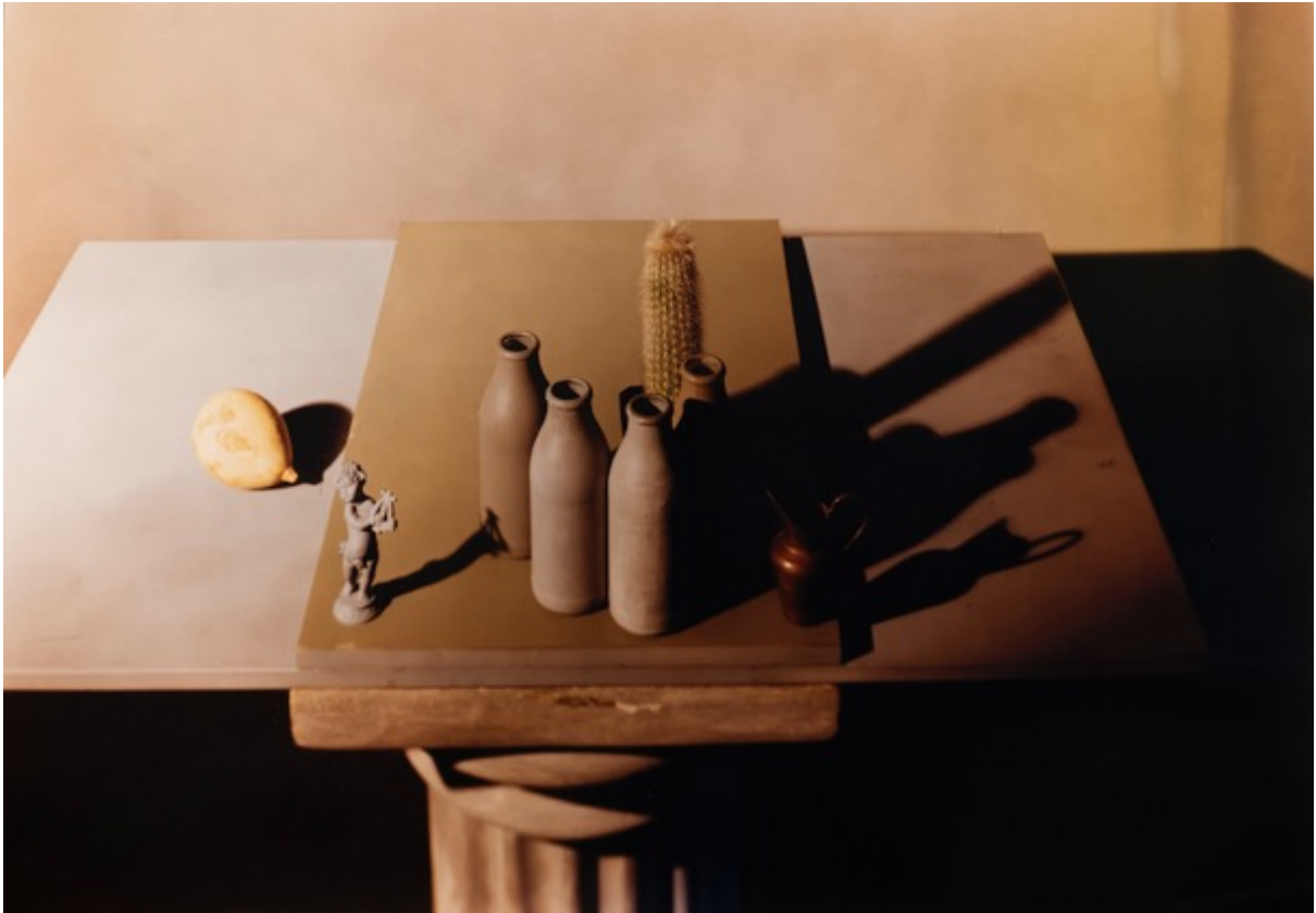
JAN GROOVER Untitled, 1987 FS 38.1

Tirage chromogénique d'époque 24x20 inch / 60x50 cm (c) Jan Groover / Galerie Miranda